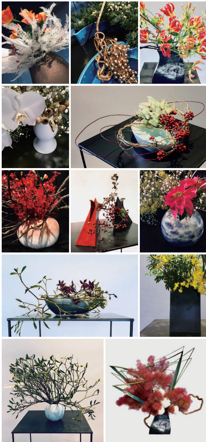
2021年度研究成果 / 草月会館ほかにて発表したいけばな作品